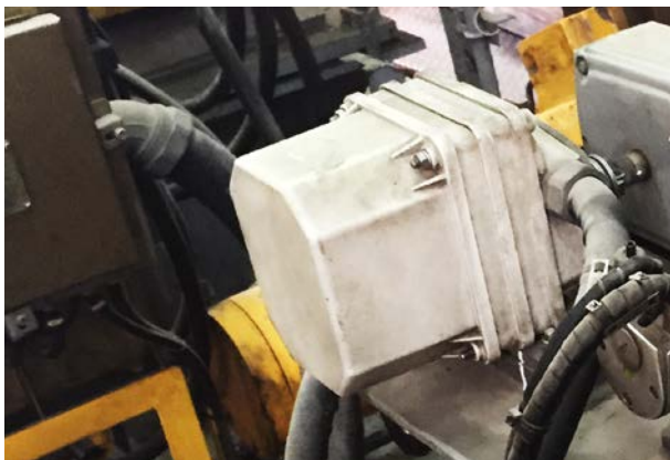
Vorher: Mechanisches Kopierwerk.